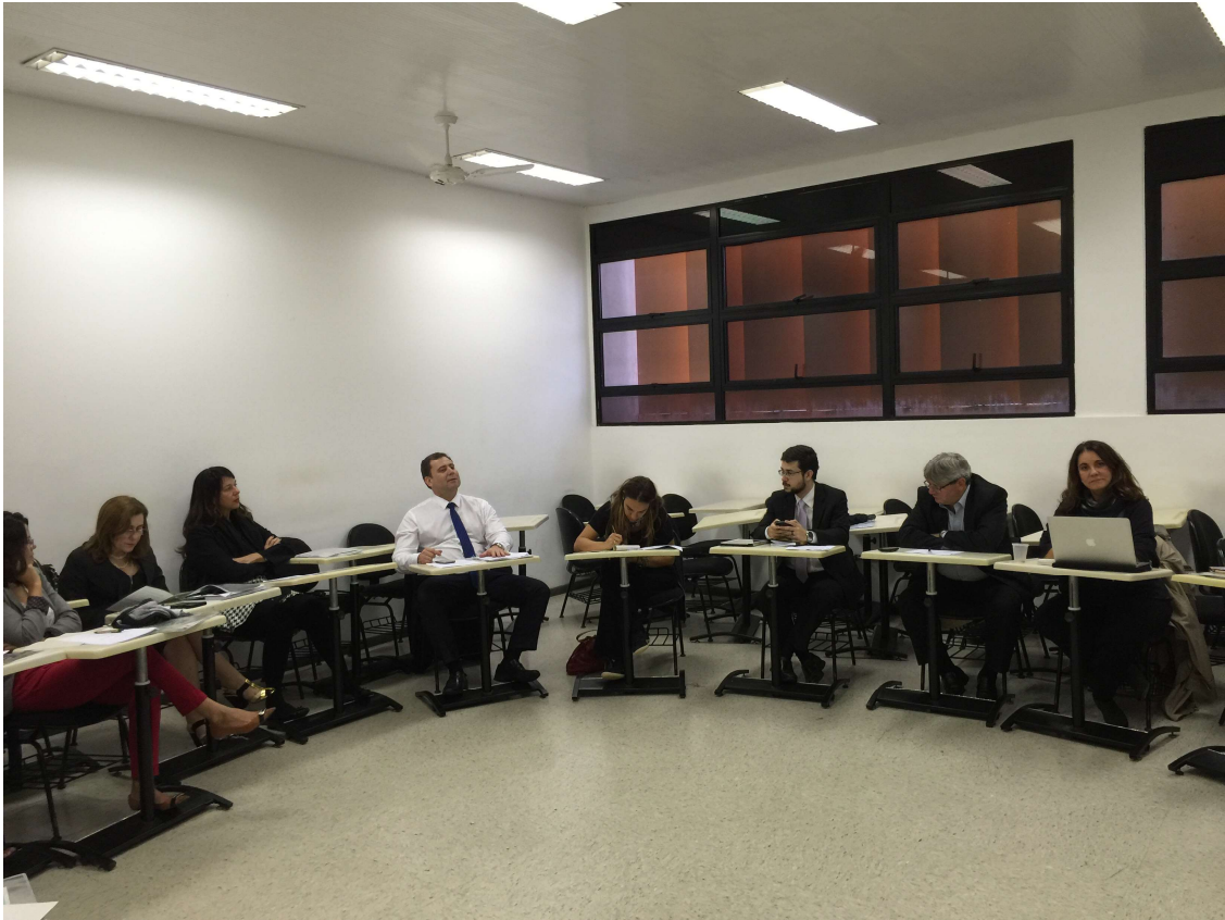
Fórum Justiça 4 de novembro de 2015 Curitiba - PR